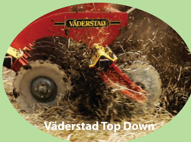
Väderstad Top Down