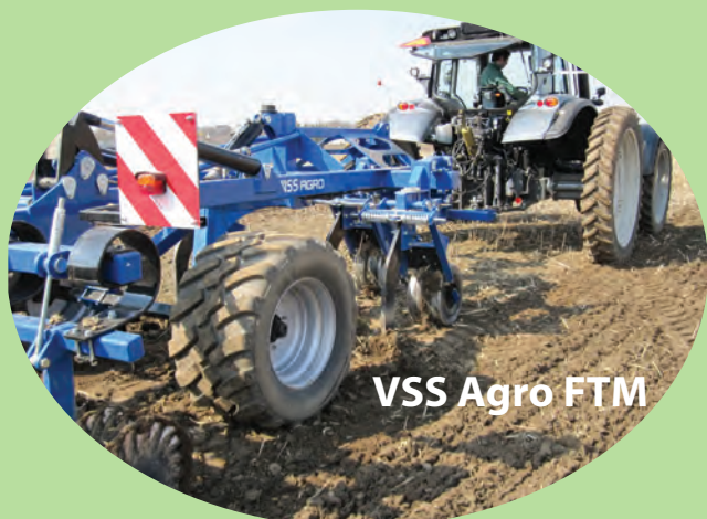
VSS Agro FTM