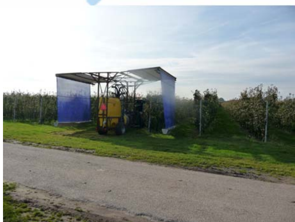
De perenbladvlo-blazer in bedrijf bij Van Hees